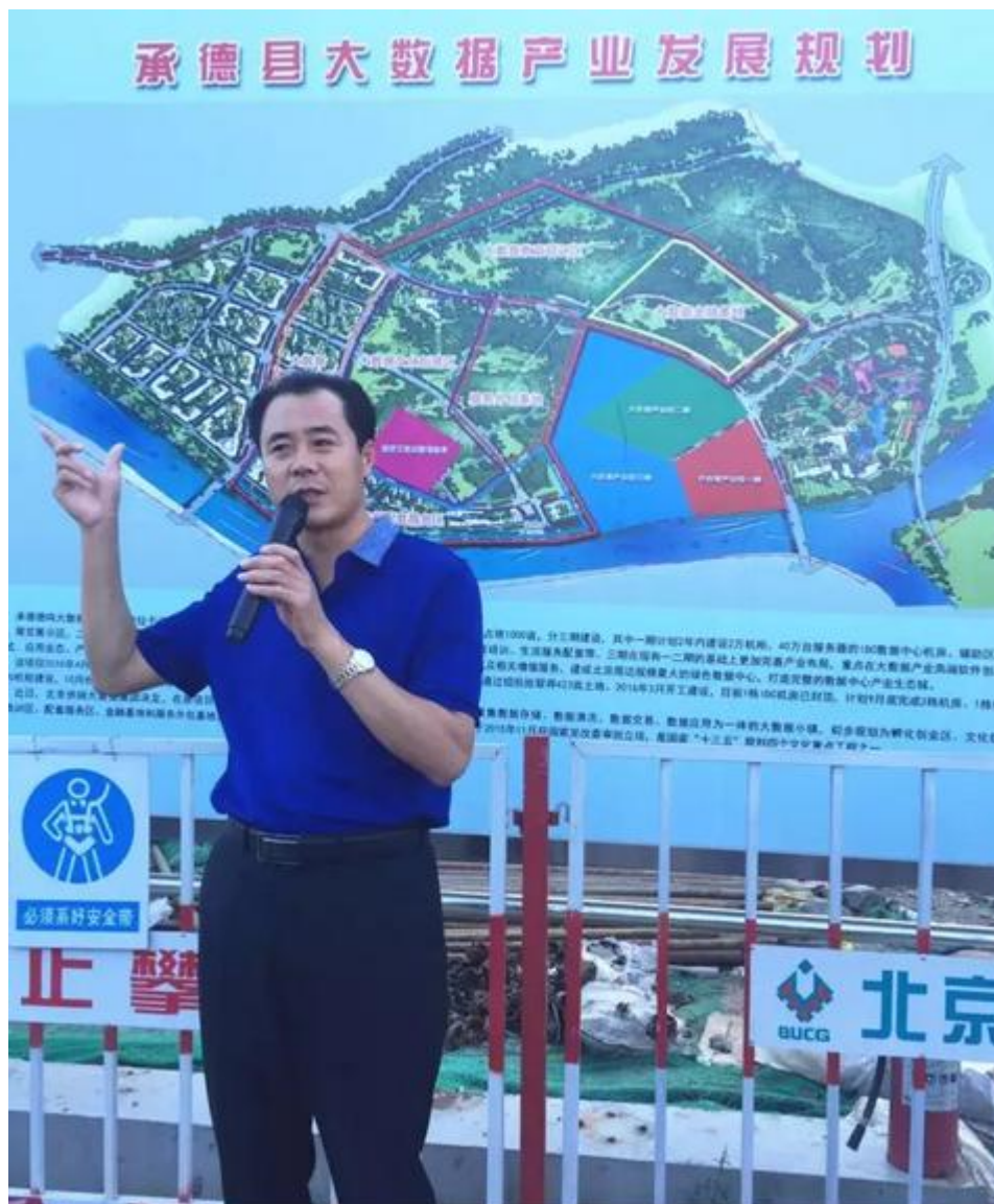
▲一行人听取相关大数据项目介绍

期间,大家就贯彻落实京津冀协同发展战略,进一步完善《京津冀大数据走廊规划研究》工作进行了广泛深入交流,大家表示要充分发挥中关村大数据研发服务和知名企业引领示范的核心作用,依托承德自然资源和成本优势,推进大数据产业在京津冀区域内合理布局,共同建设全要素支撑、全链条发展、具有全球影响力的区域性大数据综合试验区。